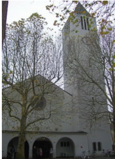
Pfarrkirche St. Hubertus Olpenerstr.954