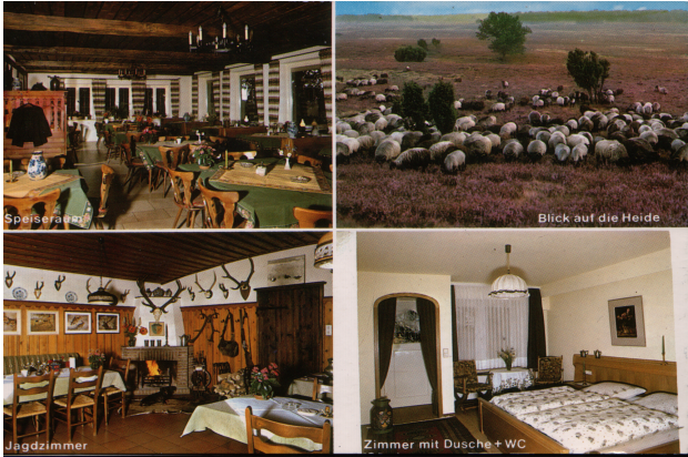
Unser Gasthof vor 35 Jahren