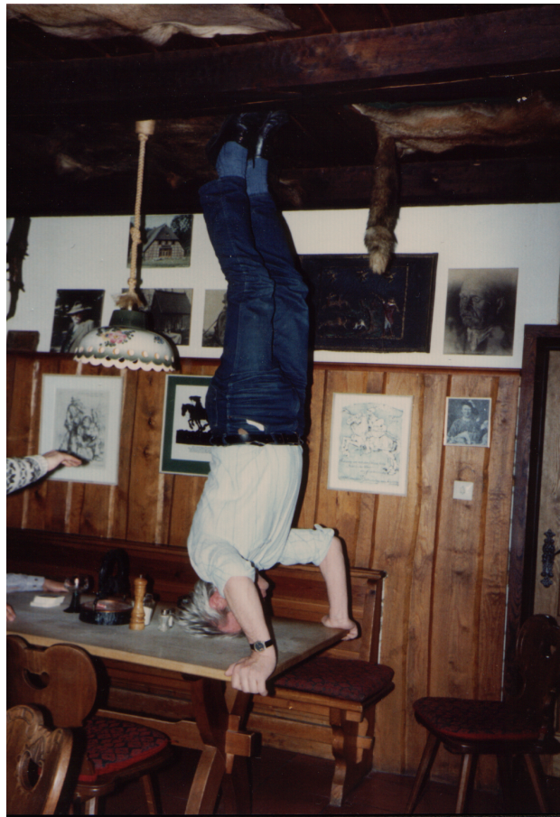
Vor 35 Jahren