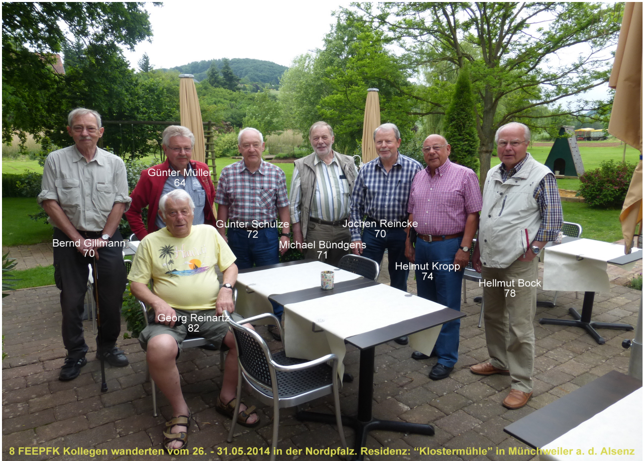
Teilnehmer Herbstwanderung Spessart Oktober 2014