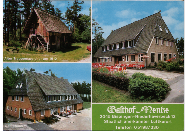
Unser Gasthof vor 35 Jahren